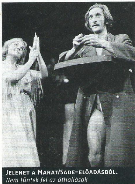
JELENET A MARAT/SADE-ELŐADÁSBÓL. Nem tűntek fel az áthallások